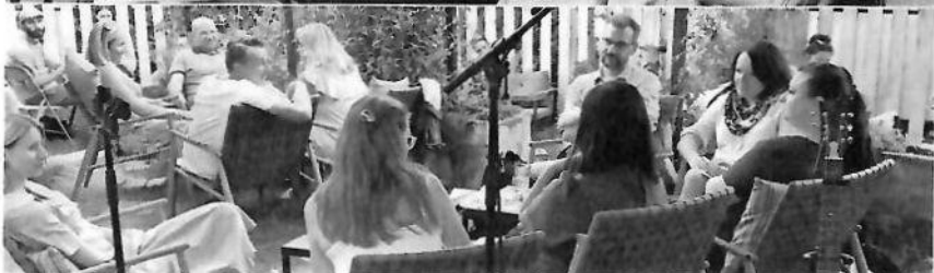
Cafe Bistro diskusia