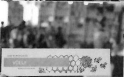
Lebo záleží na včelách

cha), Jeden rok v živote včely (D. Gerstmeier), Lumír včelári (A. F. Holasová), Poviem Ti: Kde sa berie med (K. Brykczynski, M. Bajerowiczová). Je dôležité chrániť včely, lebo na nich záleží. A ak účastníci besied splnili domácu výzvu, ktorú im uložil náš včelár Marcel – zasadiť aspoň jeden kvet – malo by v najbližšom čase v meste pribudnúť a rozkvitnúť takmer 80 kvetov.