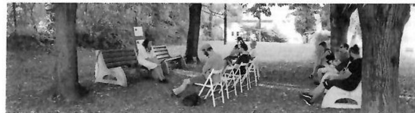
Záhrada Burjanovej vily

osobnosti späté s literatúrou a jazykom. Verejné čítania prebehli na atraktívnych a nie vždy dostupných miestach mesta. Poradie čítaní nebolo presne stanovené, nechali sme našich návštevníkov, nech si